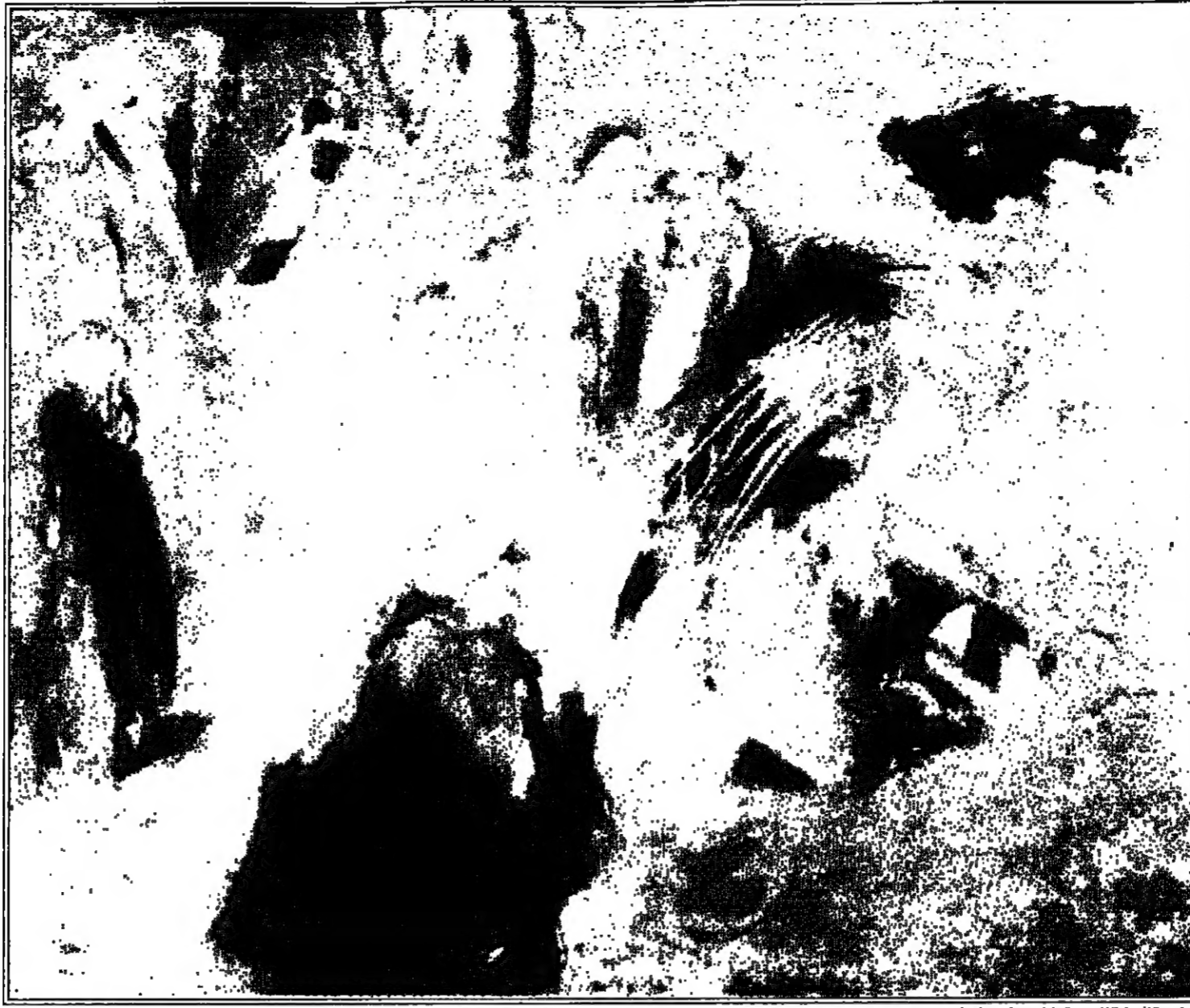
لوحة الفنانة المصرية ليلي حكيم للشارقة في البينالي

هذا العنوان غامض قليلا، ان ما قوامه تفسيره يعرف كلمة «شعرية» بأنها بالصفات الجيدة للشعر، وكلمة «بصرية» معناها رؤية متسلسلة من الصور والأحداث تظهر للشخص الناظر، وعلى الرغم من ان كلا العنصرين يمتزجان فمهما بوضوح عندما تستخدمان في الابداع فان مدخليهما التي تصيدان في القرن البصري.